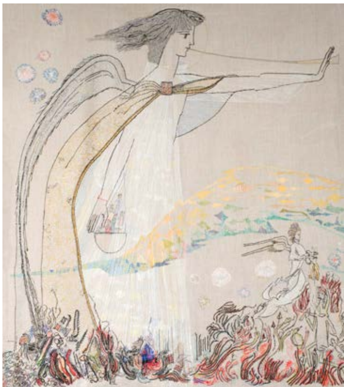
Torvald Moseid, Draumkvedet / The Dream Ballad (detalj / detail), 1980–93. © Telenor

headquarters at Fornebu near Oslo. In 2016 it was dismantled and donated to Sørlandets Kunstmuseum, in connection with the repurposing of space at Telenor's headquarters. Moseid's connections to the region of Southern Norway makes it appropriate that his chief works are incorporated into the collection at Sørlandets Kunstmuseum. The museum is deeply grateful to Telenor for the gift.