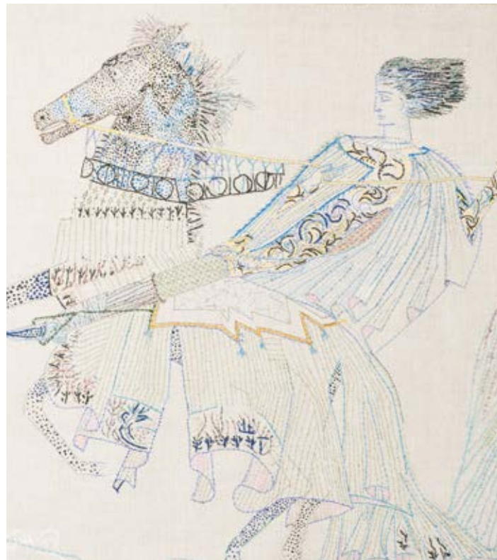
Torvald Moseid, Draumkvedet / The Dream Ballad (detalj / detail), 1980–93. © Telenor

Med forbehold om endringer. For oppdatert info se skmu.no