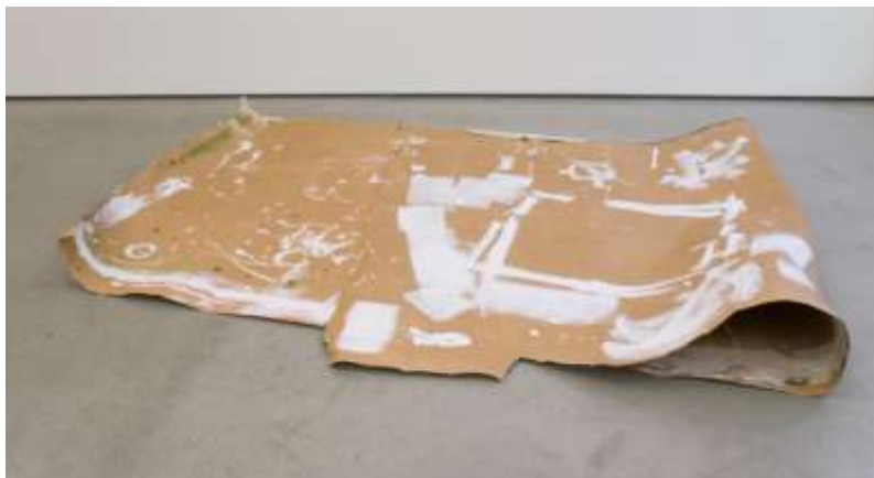
Ane Mette Hol, Untitled (Drawing for Floor #6), 2009.