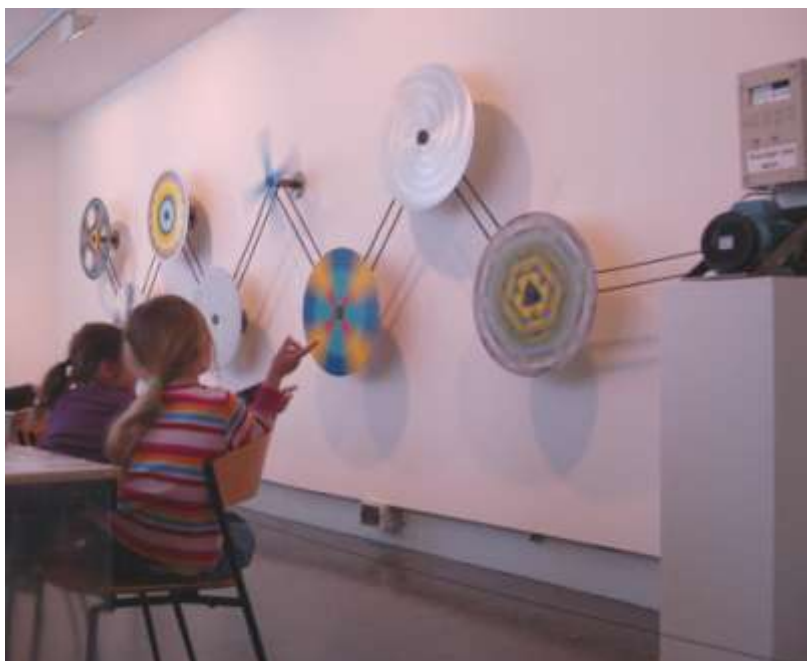
Fra verkstedet Rundt og rundt for DKS Kristiansand kommune våren 2010

Sørlandets Kunstmuseum har fått økte midler over statsbudsjettet med tanke på oppgaver i det nasjonale formidlingsnettverket. Museet følger den øvrige utviklingen og satsningen ved de andre knutepunkt-museene og Nasjonalmuseet for kunst, design og arkitektur. Det er en økt satsning på formidling og formidlingstiltak.