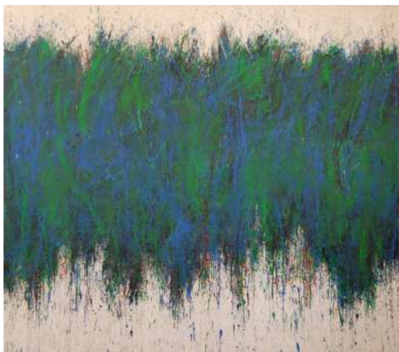
Kunstner: Jack Carrig, Tittel: After the Rain, 1960, Olje på lerret Eier: Katedralskolen i Kristiansand

Konservering av kunst på papir fortsetter ut fra prioriteringsliste basert på tilstand. Konservering av egne verk for øvrig har i hovedsak vært knyttet opp til utlån og egenproduserte utstillinger.