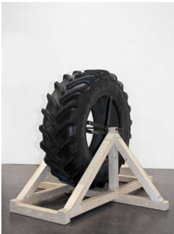
Guttorm Guttormsgaard: Lyd av hav, 2009, mixed media (traktorhjul, ballaststeiner fra europeiske strender), foto: Marit Kvaale

Det totale antall verk i samlingen er nå 1367 (pr.31.12.10)