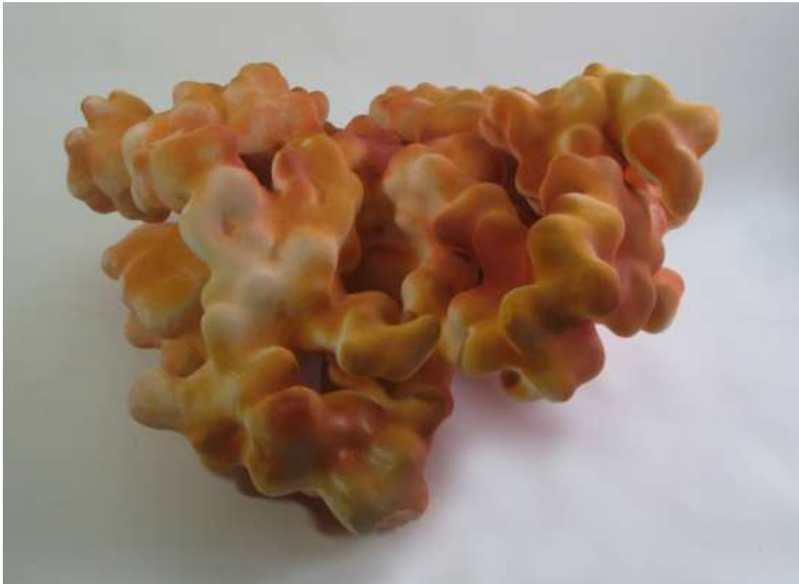
Eirik Gjedrem: Under I 2010, modellert leirgods, glaser

Det er gjennomført i alt 9 temporære utstillinger i eget bygg, inklusive utstillingen med verk av Christian Schredsvig som åpnet i 2009. I tillegg har museet 3 utstillinger i papirrommet, 2 utstillinger i prosjektrummet, samt 7 videovisninger i foajé og videorum. I samlingen har prosjektet Opus Insertum blitt gjennomført med to kunstnere fra Sør-Korea. I tillegg har museet to større vandretstillinger med utgangspunkt i museets samling som også i 2010 har turnert museer og kunstforeninger i Agder.