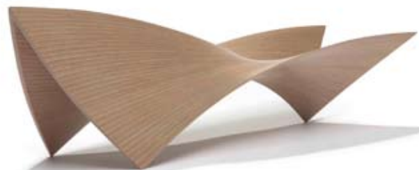
Tapio Wirkkala: Silita / Briège, Privat samling.

_____ The exhibition is made possible through collaboration between SKMU, Kunstmuseet in Tønder, EMMA Espoo Museum of Modern Art, and the Tapio Wirkkala Rut Bryk Foundation. The exhibition is supported by Nordic Culture Fund and World Design Capital Helsinki 2012.